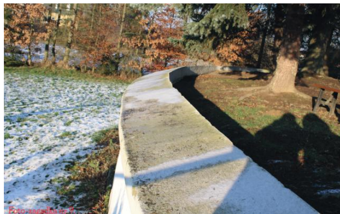
Murek przy kościele w Malicach