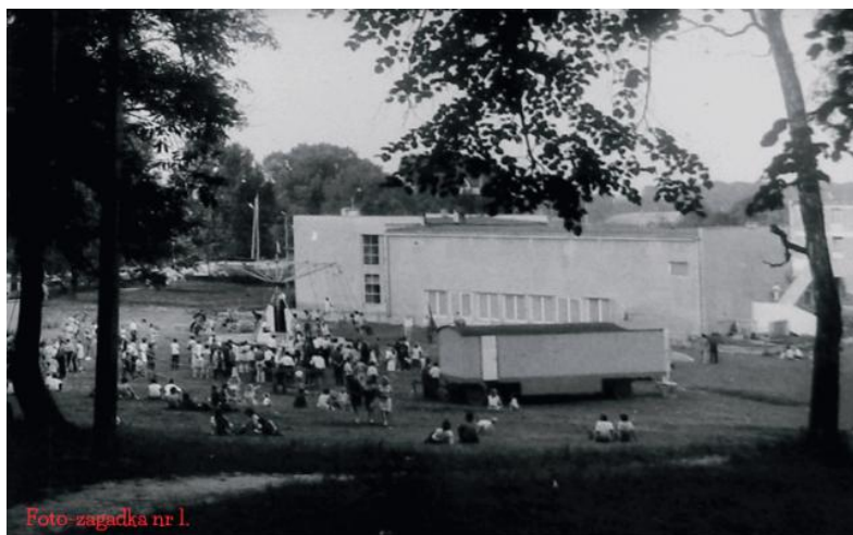
Foto-zagadka nr 1.