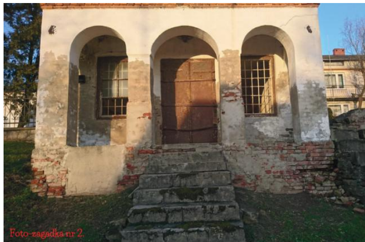
Foto-zagadka nr 2. Hostynne - sklep i siedziba Kasy Stefczyka w okresie międzywojennym - późniejszy sklep GS.

Konkurs cieszył się ogromnym zainteresowaniem, w związku z czym na pewno powtórzymy go jeszcze nie raz, a ja będę miał okazję poznać inne wspaniałe miejsca.