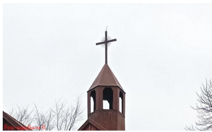
Wieżyczka kościoła filialnego w Podhorcach.