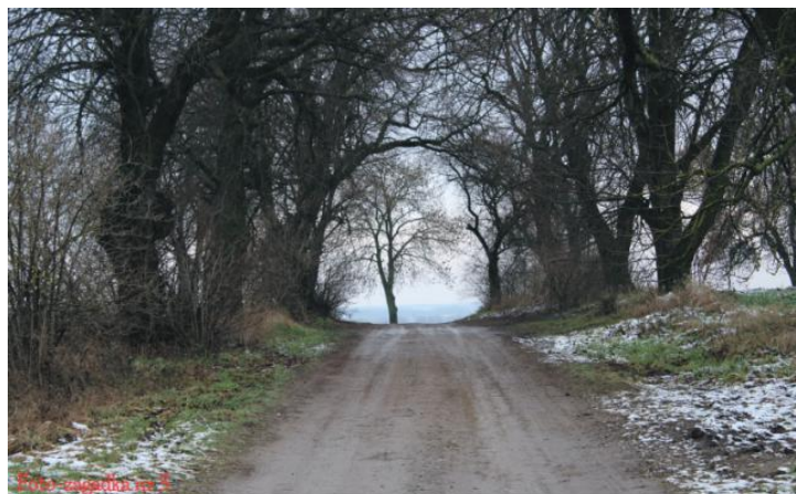
Foto-zagadka nr 3. Aleja kasztanowa w Wilkowie