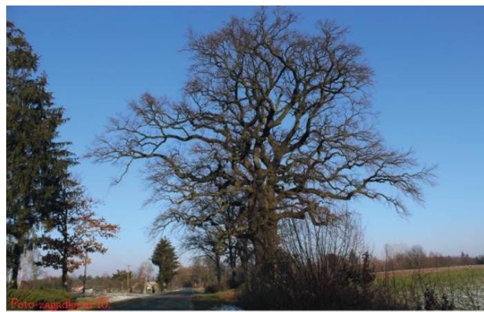
Malice - Dąb Św. Jana