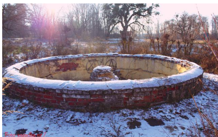
Fontanna przy Zespole Szkół w Turkowicach.