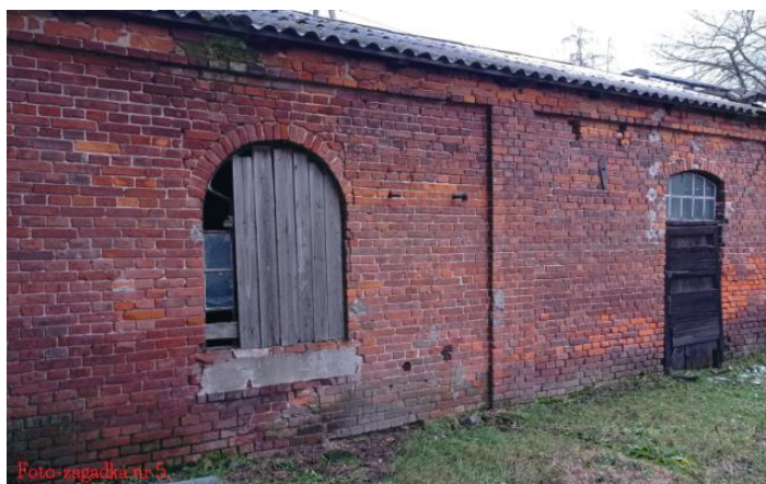
Budynek maszynowni przy drewnianym młynie w Terebińcu