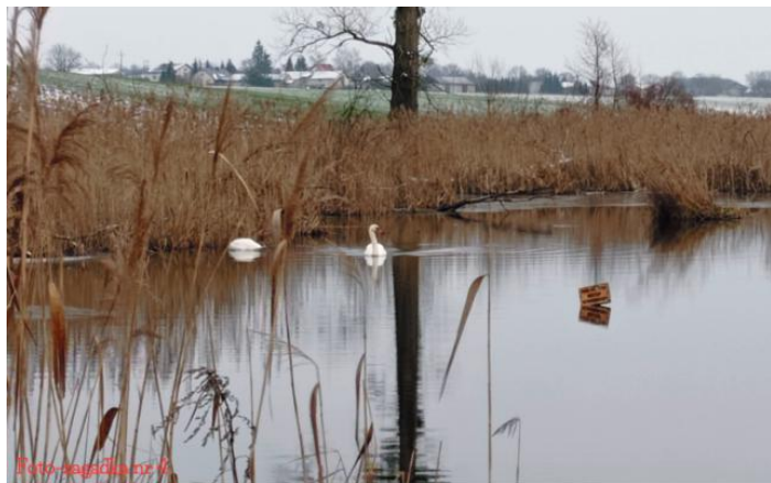
Staw Królewski w Terebińcu