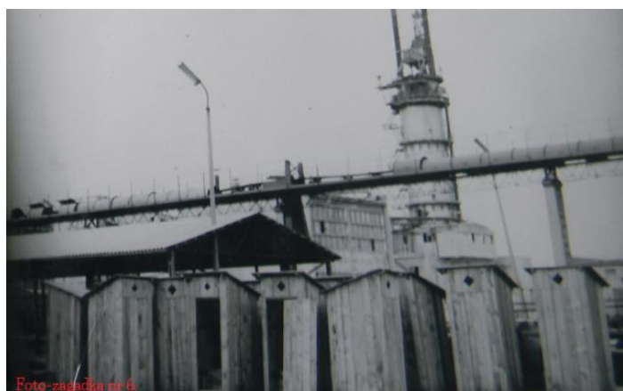
Plac fabryczny Cukrowni Werbkowice przed magazynem technicznym