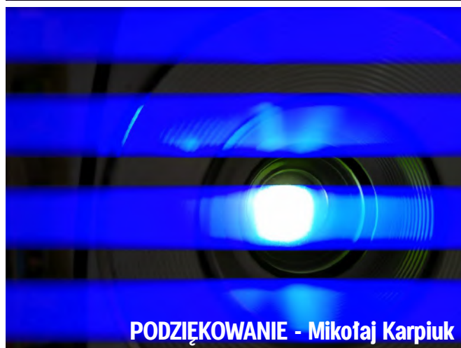
PODZIĘKOWANIE - Mikołaj Karpiuk